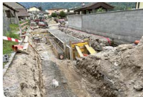
Cantiere del PGS in Via Solario a Bodio l'estate scorsa.