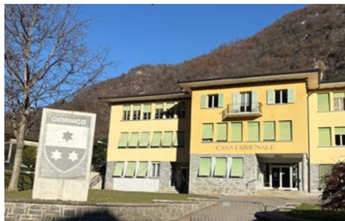
... i cittadini di Giornico a Giornico.

All'atto del deposito delle proposte è dovuta una cauzione in contanti di CHF 300: una per il Municipio e una per il Consiglio comunale. La cauzione è restituita se la lista