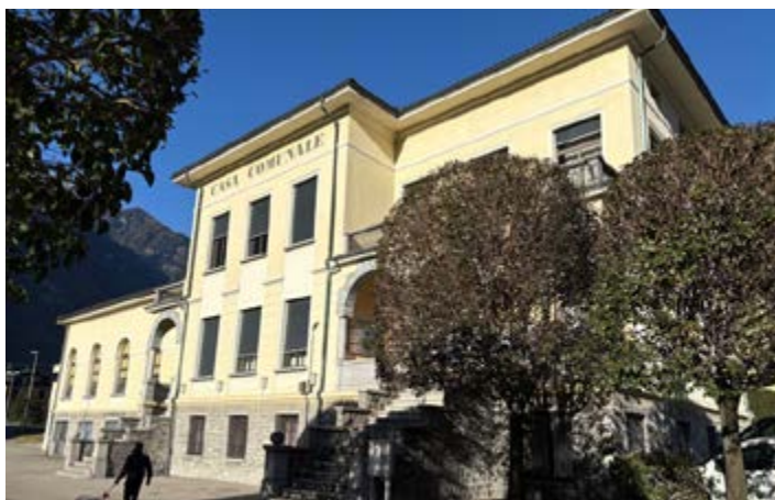
Il 6 aprile, i cittadini di Bodio votano (al seggio o per corrispondenza) a Bodio.