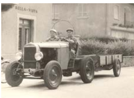
Trazione animale a Giornico e meccanica a Bodio in epoche diverse.

mento delle risorse idriche del Ticino e dei suoi affluenti, con l'inizio dell'attività della centrale della Biaschina avvenuta nel 1911, trasformarono i Comuni di Bodio e Giornico da villaggi rurali e dediti ai trasporti in centri industriali. In un primo momento fu soprattutto il villaggio di Bodio ad accogliere la maggior parte delle aziende industriali, anche se la prima ad iniziare la produzione, nel 1909, furono le officine Diamantin localizzate in territorio di Giornico. Nel 1911 quasi in contemporanea iniziarono l'attività le Officine del Gottardo, costituite nel 1909, e le Officine Nitrum, nel 1915 la Carburess du day e nel 1918 la Società elettrochimica del Lemano.