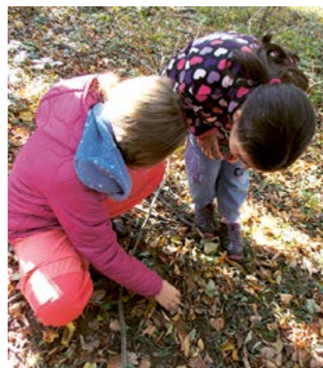
Raccolta di castagne.

Il Gruppo Genitori ha reso l'evento ancora più speciale, accogliendo i bambini all'uscita della scuola con tè caldo e castagne appena cotte. Questo momento di condivisione ha rafforzato i legami tra scuola e famiglia.