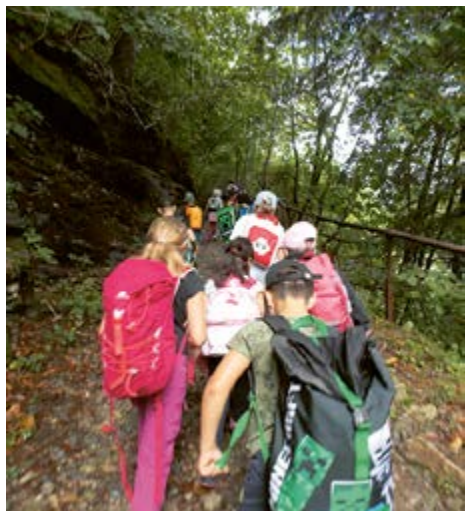
Immersione nella natura.

Le classi di 1°, 2° e 3° di Giornico hanno partecipato alla settimana del WWF dedicata alla scuola all'aperto.