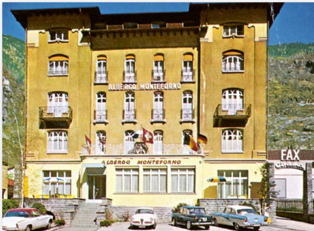
L'albergo negli anni 60.