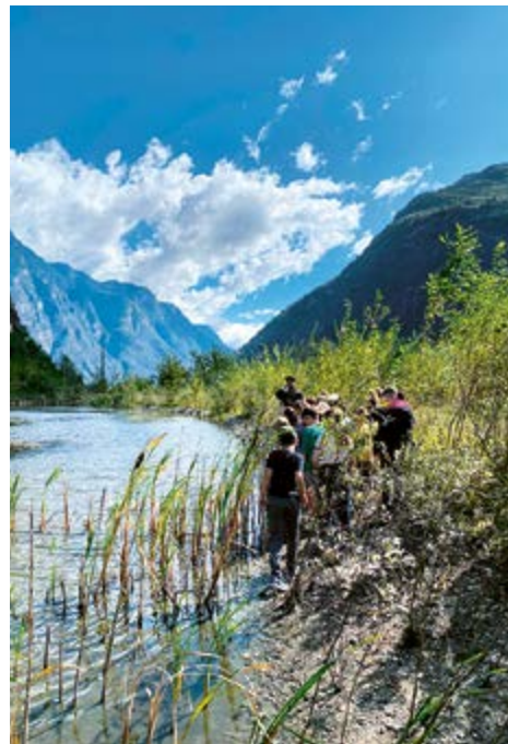
Al biotopo di Bodio Sud.

Venerdì siamo andati a Carì per fare la Carì Experience che è un percorso nel bosco in cui si possono trovare casette per le fate, mandala e sagome di legno che raffigurano animali.