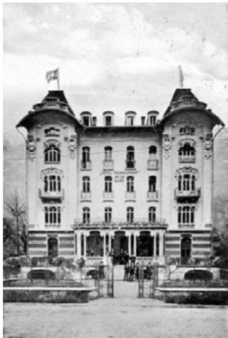
L'albergo nel 1911.