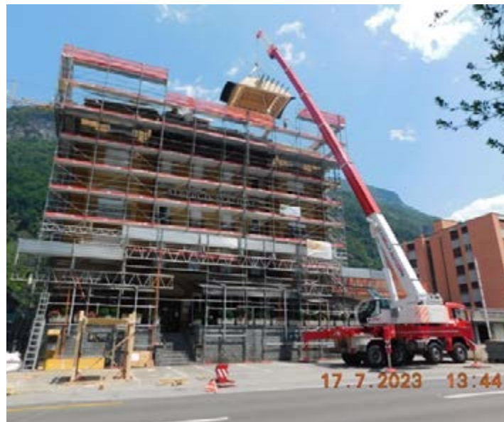
Il cantiere mentre veniva installata la cupola laterale.