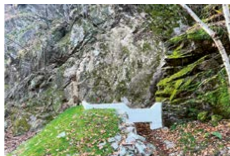
Correzione idraulica del canale sopra Altirolo.