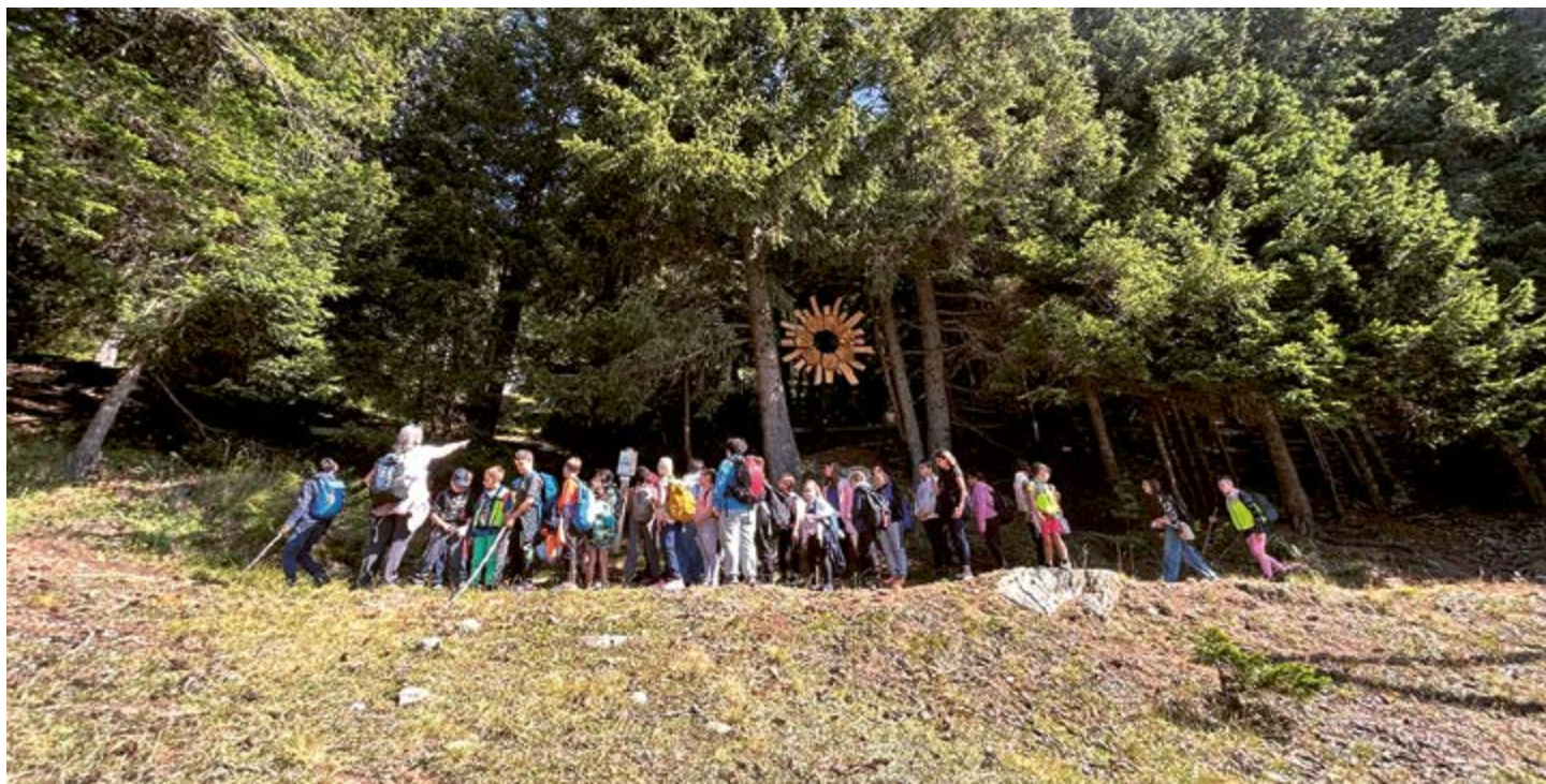
Escursione a Carì.