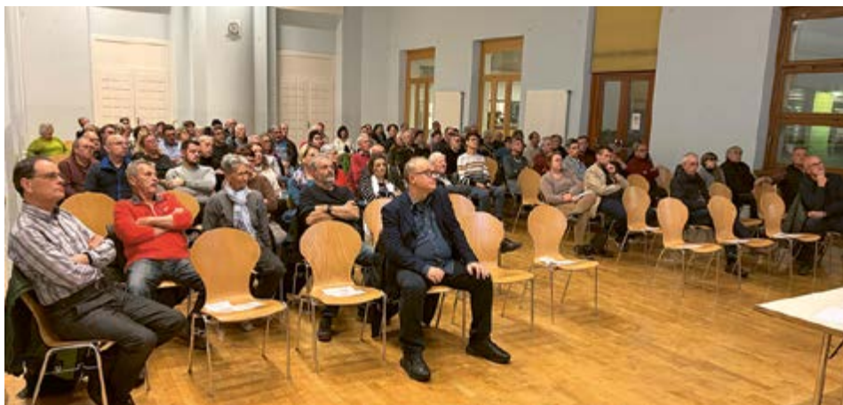
Un pubblico molto attento alla serata del 26 novembre.

Il Gran Consiglio ratifica all'unanimità dei 79 presenti la creazione del nuovo Comune.